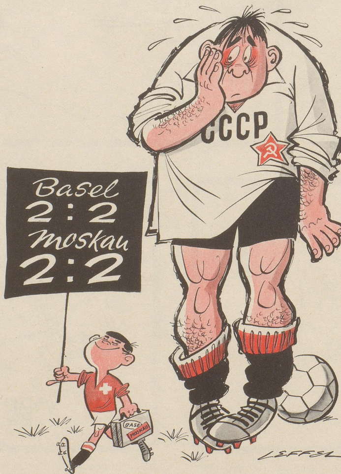
Im Fußball: Klein aber oho!

ob man nicht viel eher dem Oberstdivisionär Zollikofer glauben darf, der für den militärischen Nonkonformismus eine Lanze brach. Er führte vor Offizieren aus, der militärische Nonkonformismus fühle sich mit dem Gedanken der militärischen Wehrbereitschaft eindeutig verbunden, sehe aber den Weg zu ihrer Verwirklichung anders als auf den herkömmlichen Grundlagen. Widder