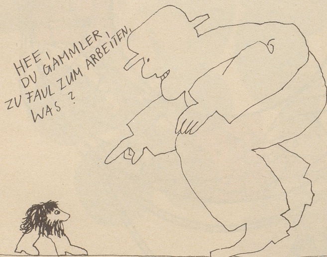
Zeichnung: René Fehr