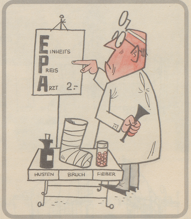
Aerzte gegen schweizerischen Einheitstarif. Ausgenommen bei Selbstbedienung.