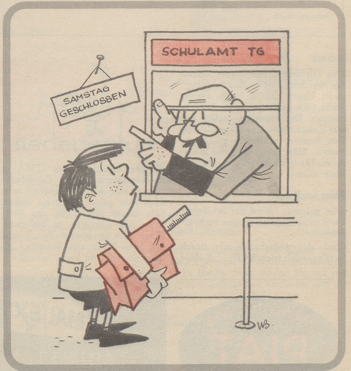
Fünftagewoche für Thurgauer Schulen nicht gestattet. «Warum?» «Auskunft am Montag, weil samstags geschlossen.»