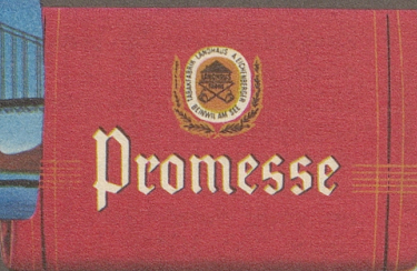
Promesse, eine natürlich duftende, wirklich milde English-Mixture