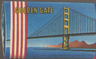
Aromatische Amerikaner-Mischung von internationalem Niveau