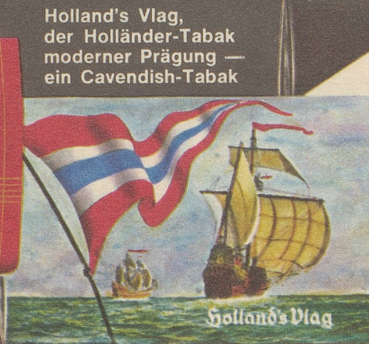
Holland's Vlag, der Holländer-Tabak moderner Prägung — ein Cavendish-Tabak