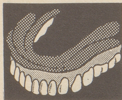
Nur anwendbar bei Prothesen aus Plastik, nicht aber bei solchen aus Gummi oder Metall.

Neu! Die SMIG-Gebiss-Kissen machen den Schmerzen und Beschwerden sofort ein Ende, die durch zu lose sitzende künstliche Gebisse entstehen. Dieses weiche Plastik-Kissen hält die Prothese fest, weil es schmiegsam und elastisch ist wie das Zahnfleisch selbst. Sie können nach Belieben essen, sprechen und lachen! Das Gebiss folgt allen Bewegungen des Kiefers, und Ihr Zahnfleisch schmerzt nicht mehr. Das SMIG-Kissen bleibt immer schmiegsam. Es kann weder hart werden noch das Gebiss beschädigen. Es schmiegt sich gefügig ein, vom ersten Augenblick des Einlegens an. Ohne Geschmack, ohne Geruch, hygienisch! Es lässt sich im Nu reinigen. Die sonst gebräuchlichen Haftmittel werden durch SMIG überflüssig. Verlangen Sie SMIG-Kissen und machen Sie den Beschwerden, die Ihnen Ihr Gebiss verursacht, ein Ende! Erhältlich in allen Apotheken u. Drogerien. Die Packung Fr. 5.80.