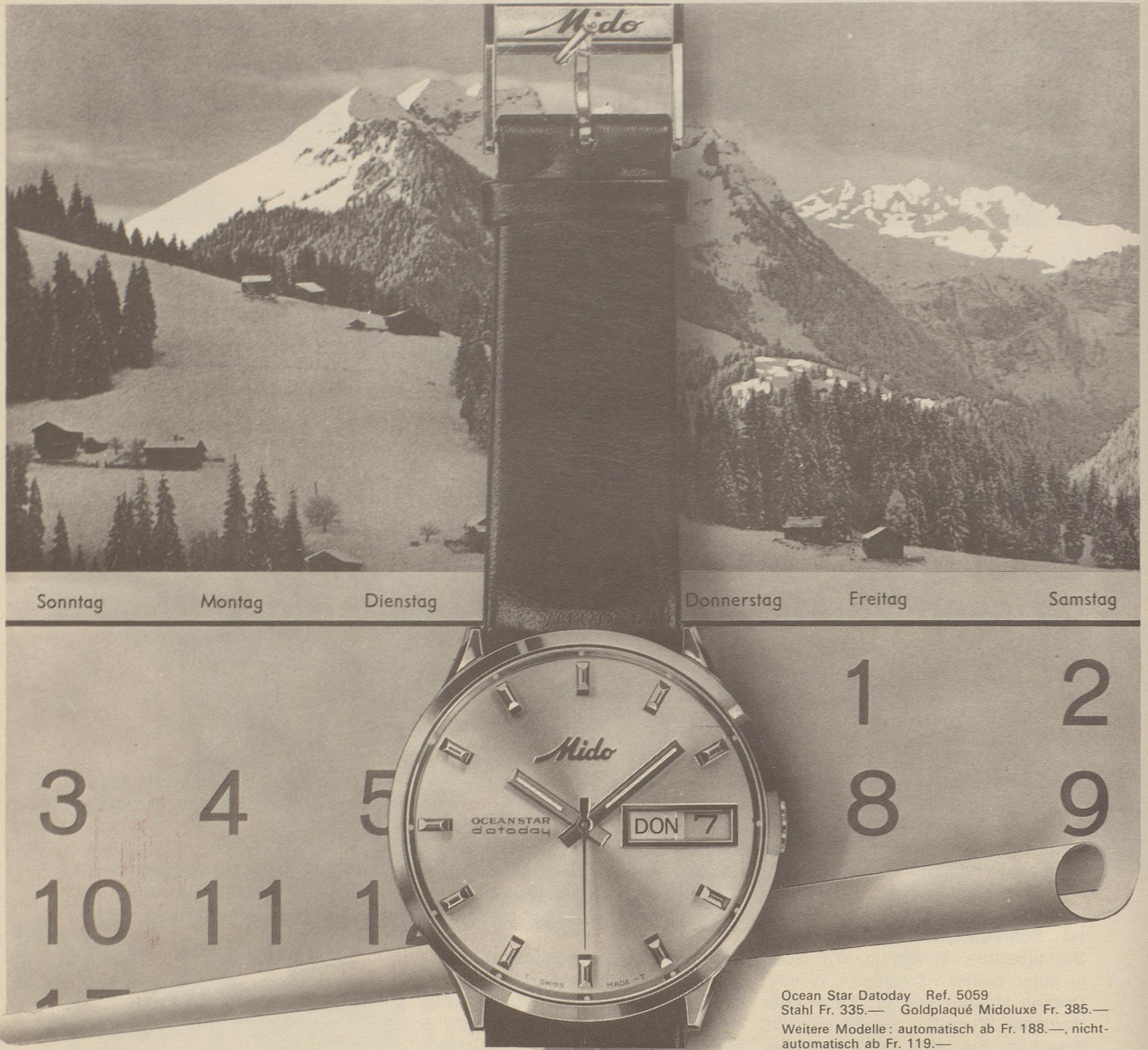
Ocean Star Datoday Ref. 5059 Stahl Fr. 335.— Goldplaqué Midoluxe Fr. 385.— Weitere Modelle: automatisch ab Fr. 188.—, nicht- automatisch ab Fr. 119.—