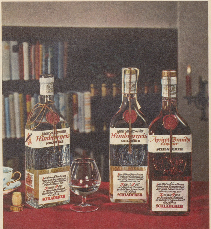
SCHLADERERS echter Schwarzwälder Himbeergeist und Apricot

Schon der Duft verheisst höchsten Genuss – das vollkommene Aroma übertrifft Ihre Erwartungen!