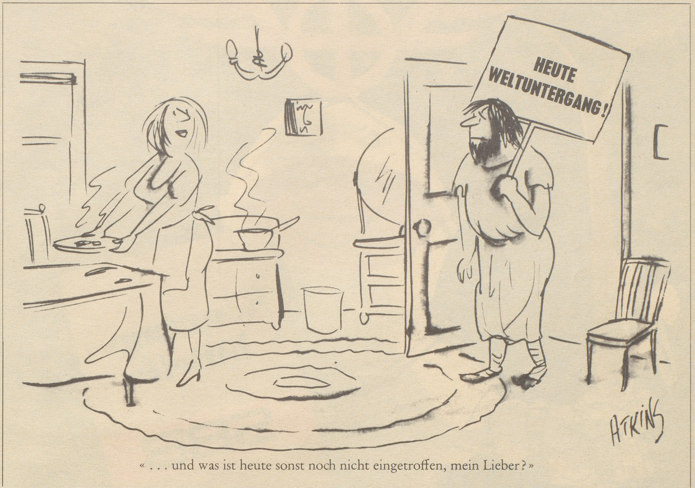
«... und was ist heute sonst noch nicht eingetroffen, mein Lieber?»