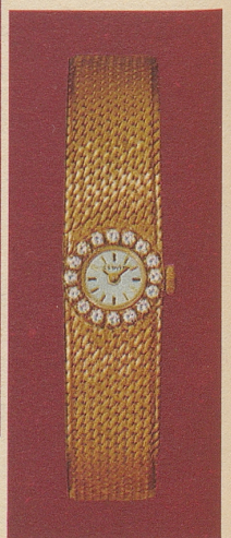
GX 401126 Gold 18 Kt. 16 Brillanten Fr. 2'230.-