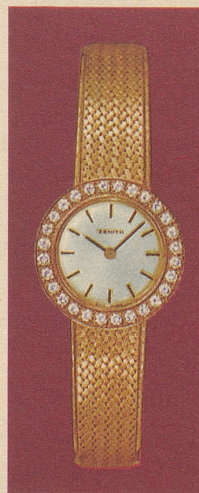
GX 401157 Gold 18 Kt. 28 Brillanten Fr. 2'780.-

Uhrenfabriken ZENITH S.A., Le Locle/Schweiz