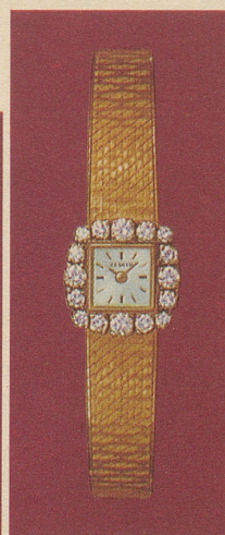
GX 401148 Gold 18 Kt. 16 Brillanten Fr. 3'600.-