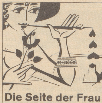
Die Seite der Frau

Oder: «Das Frauenstimmrecht hat auch Nachteile. Zum Beispiel sind