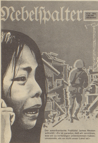
Der amerikanische Publizist James Reston schreibt: «Es ist paradox, daß wir zürstören, was wir zu verteidigen unternommen haben, unsomehr, als es nicht unser Land ist!»