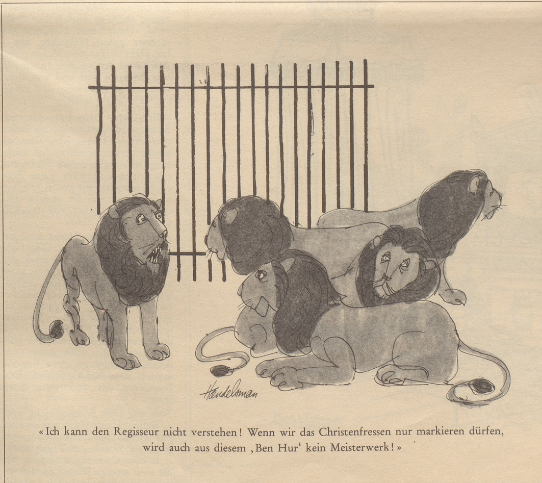
«Ich kann den Regisseur nicht verstehen! Wenn wir das Christenfressen nur markieren dürfen, wird auch aus diesem 'Ben Hur' kein Meisterwerk!»