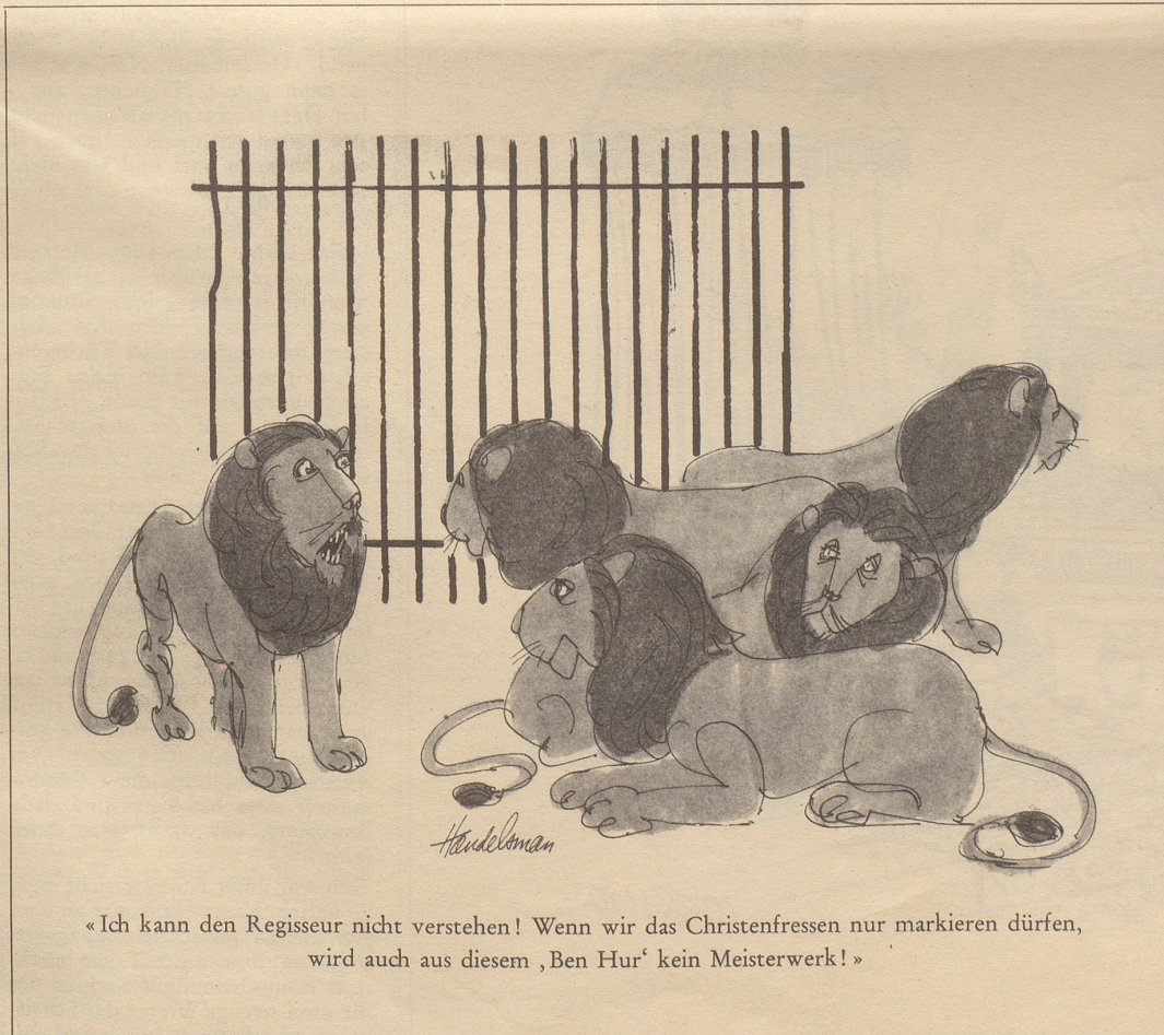
«Ich kann den Regisseur nicht verstehen! Wenn wir das Christenfressen nur markieren dürfen, wird auch aus diesem 'Ben Hur' kein Meisterwerk!»