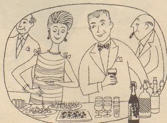
Am Party-Buffer darf er nicht fehlen, der beliebte gehaltvolle Traubensaft

Kaninchen sind sicher ebenso liebe Nerze, und ihre Pelze geben gleich warm. Und doch ist der Nerz begehrt weil er exklusiver ist. Alle Teppiche decken den Boden, und doch sind Orientteppiche von Vidal an der Bahnhofstraße 31 in Zürich begehrt, weil sie feiner, und schöner sind, ein zusätzlicher Schmuck auch des elegantesten Heimes.