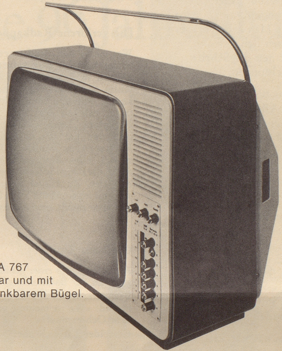
WEGA 767 tragbar und mit versenkbarem Bügel.

Sein eigenes Programm wählen und sehen. Ungestört in einem andern Raum fernsehen. Nicht stur auf demselben Fernsehstuhl sitzen. Unabhängig vom Fernseh-Antennen-Anschluss sein. Überhaupt: Weil der WEGA 767 tragbar ist — überall fernsehen, wie es einem gerade gefällt und einfällt. Aber mit einer guten Bildqualität, einem guten Ton und einer guten Form. Sehen Sie: Fernseh-Individualisten haben viele individuelle Gründe für den