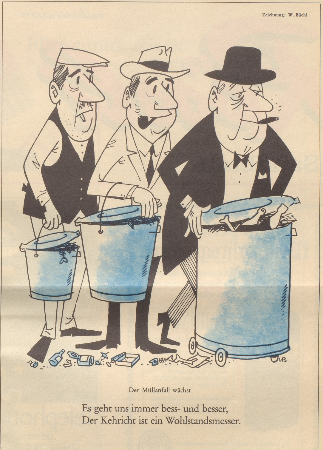
Der Müllanfall wächst

Es geht uns immer bess- und besser, Der Kehricht ist ein Wohlstandsmesser.