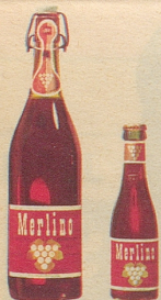
Merlino Traubensaft auch in der Liter- und der 2-dl-Flasche

Sie können und werden es sein, wenn Sie schon als Auftakt viel frohe Laune auf den Tisch stellen mit Merlino Grand Raisin und Merlino Clairet. Diese neuen Dreistern-Traubensäfte sind eine Zierde für jeden Tisch: der weisse, moussierende Grand Raisin ist Auftakt und Höhepunkt jedes Festes, und der fruchtig-rubinrote Clairet passt sehr gut zu den Mahlzeiten und den modernen Snacks. Sie dürfen damit grosszügig sein, denn die Flasche kostet nur Fr. 2.95 (mit Rabatt, Einwegflasche ohne Pfand). Erhältlich in Lebensmittelgeschäften, Reformhäusern, Drogerien und durch unsere Depots in der ganzen Schweiz.