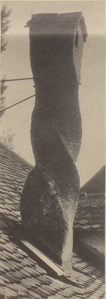
Was hat wohl dem Kaminbauer in Murten so den Kopf verdreht?