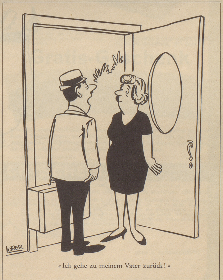
«Ich gehe zu meinem Vater zurück!»

«Ich habe meinem Fifi versprochen, punkt sechs Uhr zu Hause zu sein.»