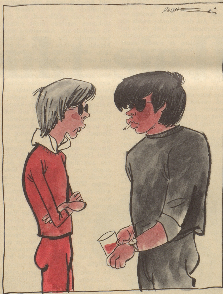
Zum erstenmal wurden an den Olympischen Spielen Geschlechtskontrollen durchgeführt

Präsident Johnson will jedem amerikanischen Touristen eine Steuer abknöpfen, der im Ausland pro Tag mehr als sieben Dollar ausgibt. Die europäischen Betriebe mögen aber ob dem Mangel an Fremdenverkehr nicht verzweifeln! Wenn es wirklich nicht mehr geht, werden die Amerikaner schon wieder kommen und sie übernehmen. Ohne auf ihren Reisespesen über sieben Dollar auch nur die geringste Steuer zu zahlen!