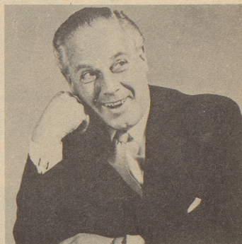
Wer sagt, daß man mit 60 alt sein muß? Der Gesundheit sind keine Grenzen gesetzt.