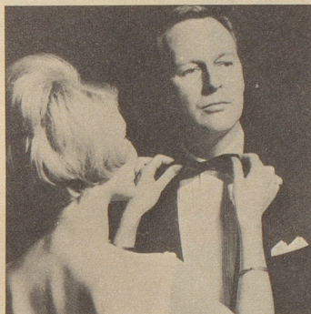
Der Telepander verlängert Ihr Leben. Ihre jugendliche Spannkraft bleibt Ihnen erhalten.