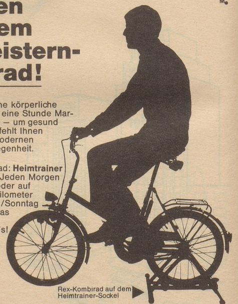
Rex-Kombirad auf dem Heimtrainer-Sockel

Verlangen Sie Prospekt und Preisliste mit den günstigen Teilzahlungsbedingungen: REX-VERTRIEB AG, 4500 Solothurn.