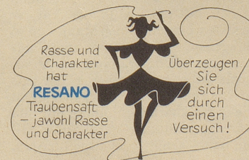
Hersteller: Brauerei Uster

Als Prunkstück und gleichzeitig als Beweis dafür, daß in Zürich tatsächlich Leute mit fasnächtlichen Talenten leben, wird in der Regel als Nummer eins der Künstlermaskenball angeführt. Er gilt – samt dem montäglichen Kehraus – als