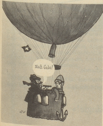
Jüsp in Nebelspalter, Switzerland