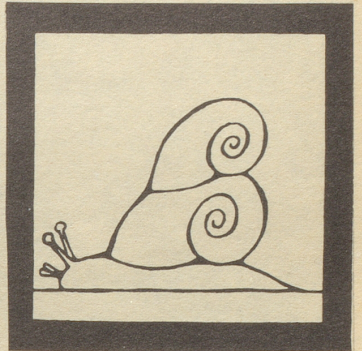
Wohlhabende Schnecke mit Zweiflhaus