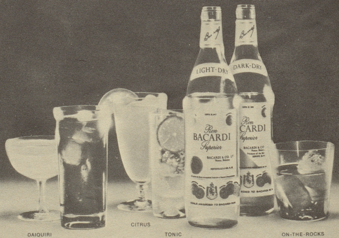
GAIQIRI COLA CITRUS TONIC ON-THE-ROCKS