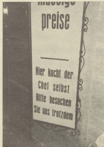
Aufgenommen in Alassio von H. Müller, Luzern