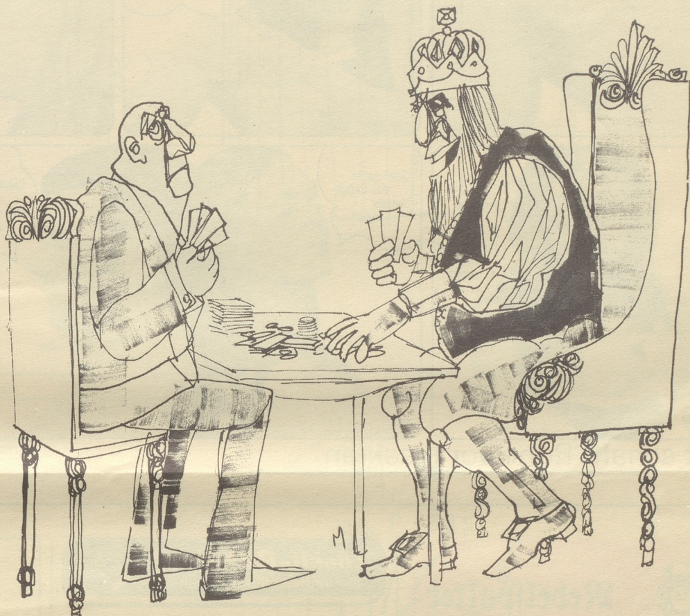
«Vier Könige — ich inbegriffen!»