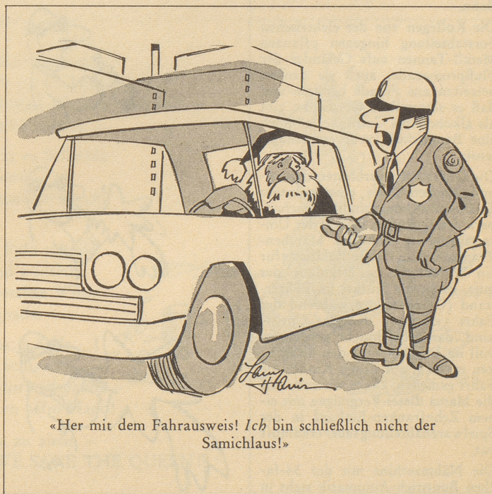
«Her mit dem Fahrausweis! Ich bin schließlich nicht der Samichlaus!»

Das walte Gott, auf dessen Providentia wir Schweizer uns hochhoffiziell noch immer verlassen!