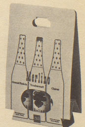
2 Grand Raisin und 1 Clairet im Multipack Fr. 7.85 (statt Fr. 8.85)

Erhältlich in Lebensmittelgeschäften, Reformhäusern, Drogerien und durch unsere Depositäre