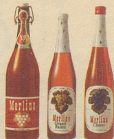
die drei beliebten Merlino Traubensäfte

Merlino Grand Raisin , weiss, moussierend, prickelnd, der passende Auftackt für jedes Fest, Merlino Clairet , rubinrot, fruchtig, passend zu den Mahlzeiten — beide in der schlanken Einwegflasche, zu nur Fr. 2.95 (mit Rabatt), Merlino weiss und rot in der vorteilhaften Literflasche zu nur Fr. 2.65 statt Fr. 2.95 (mit Rabatt).