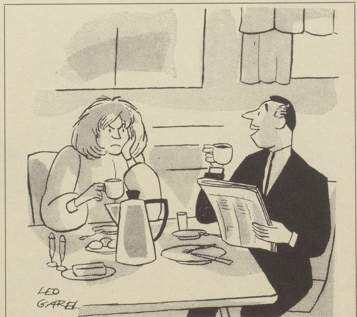
«... was mir jeden Morgen so verheißungsvoll macht ist die Vorfreude auf einen wirklich guten Kaffee im Büro!»

Nach zwei Stunden schrillte bei mir das Telefon. Peters Stimme klang recht modulationsreich: «Was fällt dir eigentlich ein, mir an meinem freien Donnerstagnachmittag einen Patienten zu schicken? Der