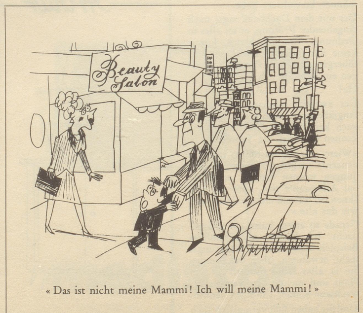
« Das ist nicht meine Mamma! Ich will meine Mamma! »

Solche und ähnliche Zeiterscheinungen pflegen wir bei Tisch mit unseren Sprößlingen zu diskutieren, und unserer erzieherischen Sendung bewußt, sparten wir hier nicht mit verachtungsvollen Kommentaren für solch verruchten Snobismus. Leider kam ich nicht dazu, alle meine vorrätigen trafen Argumente in die Diskussion zu werfen,