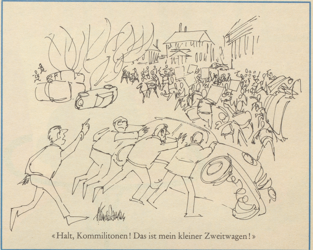
«Halt, Kommilitonen! Das ist mein kleiner Zweitwagen!»

Igor Strawinsky erzählte, daß er einmal einer hochnotpeinlichen Untersuchung durch den italienischen Zoll unterzogen wurde, als er von Italien nach der Schweiz fahren wollte. «Und warum das alles?» schloß Strawinsky. «Die Beamten hatten in einem meiner Koffer das Porträt entdeckt, das Picasso einmal von mir gemacht hat. Sie hielten das Blatt für eine Lageskizze italienischer Festungswerke und mich für einen ausgemachten Spion.» TR