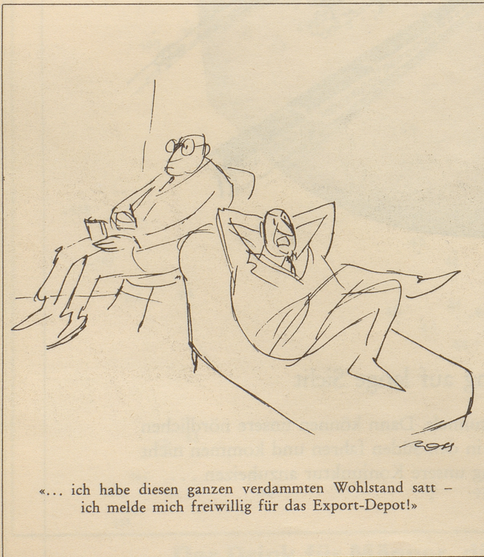
«... ich habe diesen ganzen verdammten Wohlstand satt - ich melde mich freiwillig für das Export-Depot!»

Aber ich, der Bundesweibel, kenne meine Pflicht. Ich habe die Information verteidigt und gesagt: «Schau, Unmögliches kann man nicht von denen verlangen. Beim Militärdepartement haben sie jetzt soviel Scherereien mit Leuten, die Geheimnisse, welche schon lange keine mehr sind, weiterplaudern, daß sie sich nicht auch noch mit irrsinnig anmutenden Plänen von Reckingen befassen können.» So loyal bin ich!