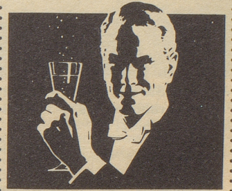
Ihr Sekt für frohe Stunden