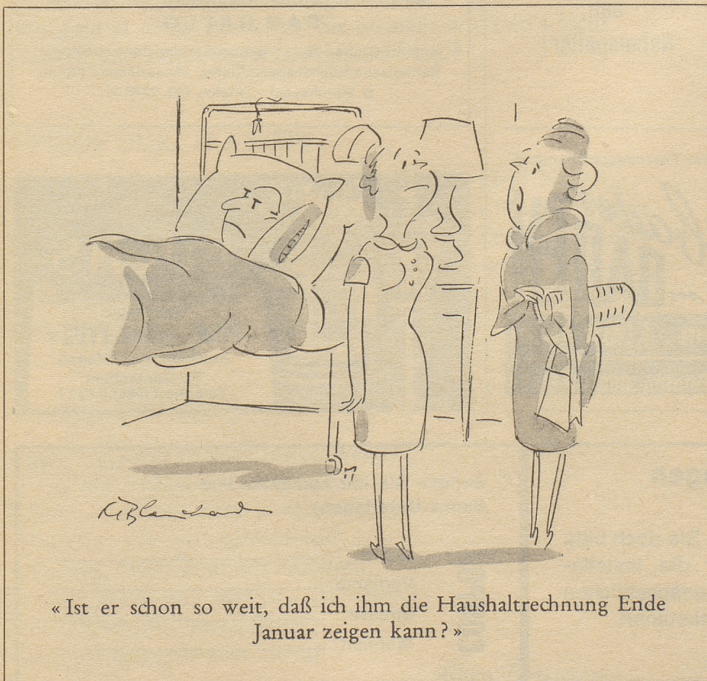
«Ist er schon so weit, daß ich ihm die Haushaltrechnung Ende Januar zeigen kann?»

lernt Hans nimmermehr, sagt man den Kindern und hofft, sie werden sich dann in der Schule mehr anstrengen. Indessen lernt der Vater sein Englisch im Schlaf und die Mutter hat ihr Italienisch in den Ferien aufgehabelt. Das allgemeine Wissen bezieht man am besten aus dem Nebelspalter. Unter anderem steht dort zu lesen, daß die schönsten Orientteppiche von Vidal an der Bahnhofstraße 31 in Zürich kommen.