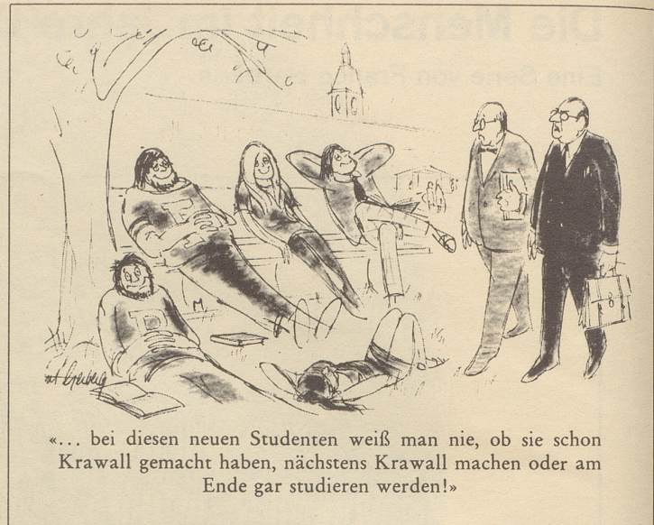
«... bei diesen neuen Studenten weiß man nie, ob sie schon Krawall gemacht haben, nächstens Krawall machen oder am Ende gar studieren werden!»

Dazu möchte ich den Rektor der Hochschule St.Gallen für Wirtschafts- und Sozialwissenschaften, Prof. Kne-