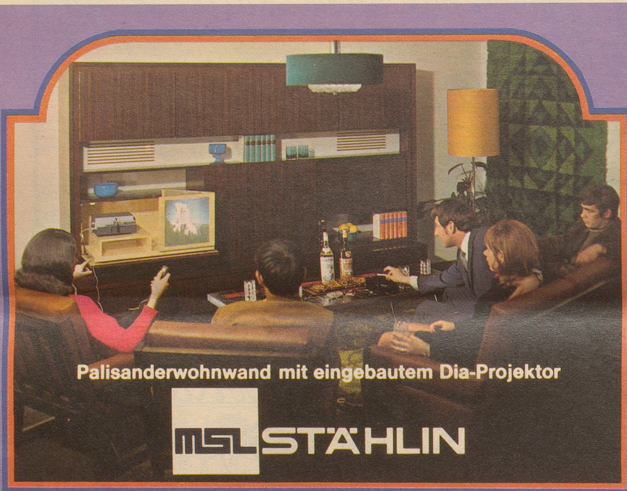
Palisanderwohnwand mit eingebautem Dia-Projektor