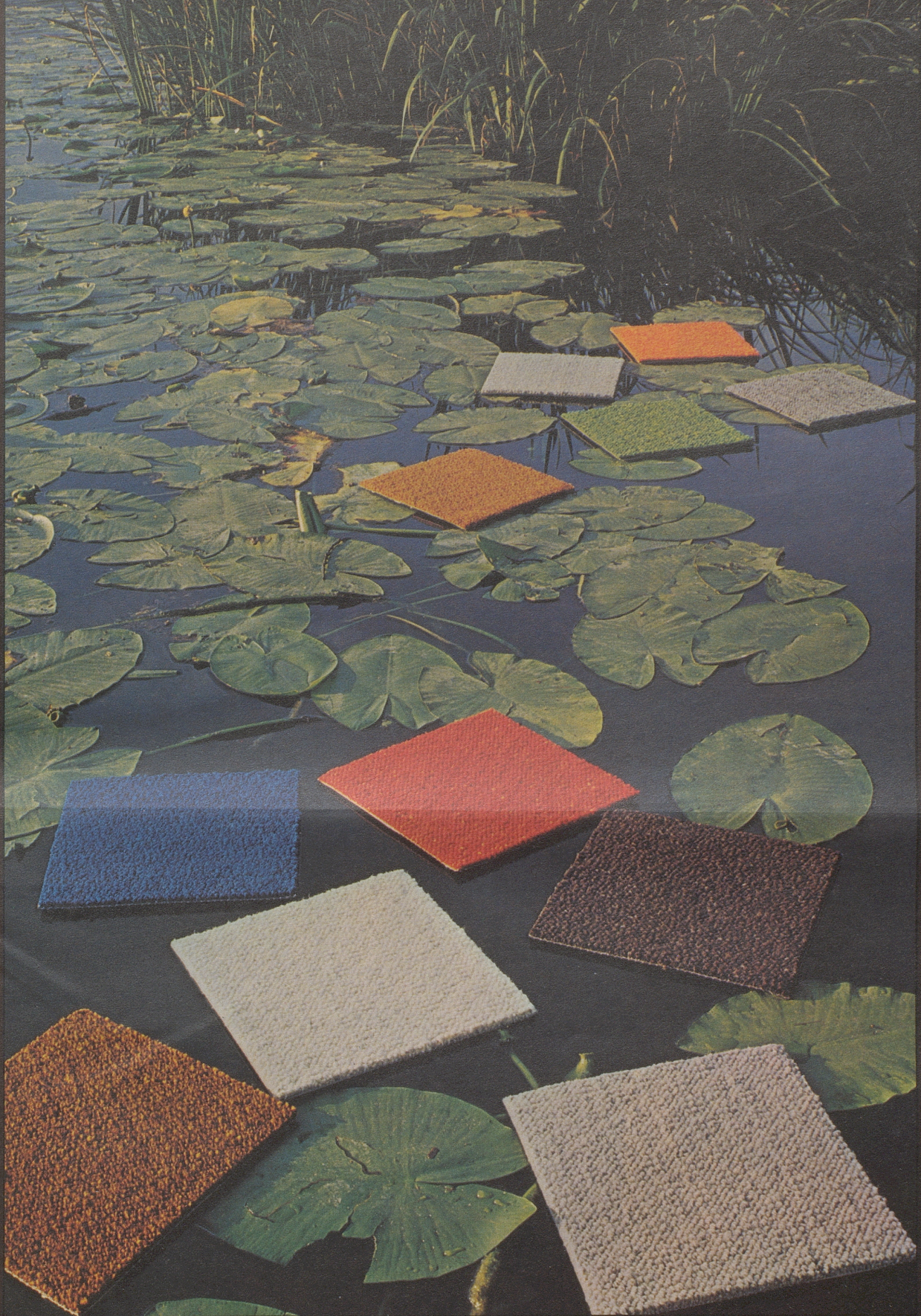
Auf dem Moosseedorf-See fotografiert für Tisca und das International Wool Secretariat ☺