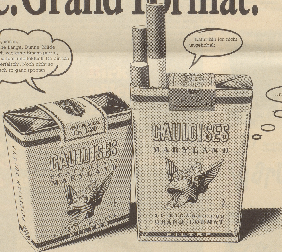
Die neue Gauloise Gelb Filter. Grand Format. Milder Maryland-Tabak. Fr. 1.40.