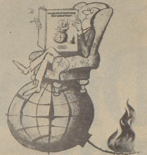
Politische Karikaturen von Horst