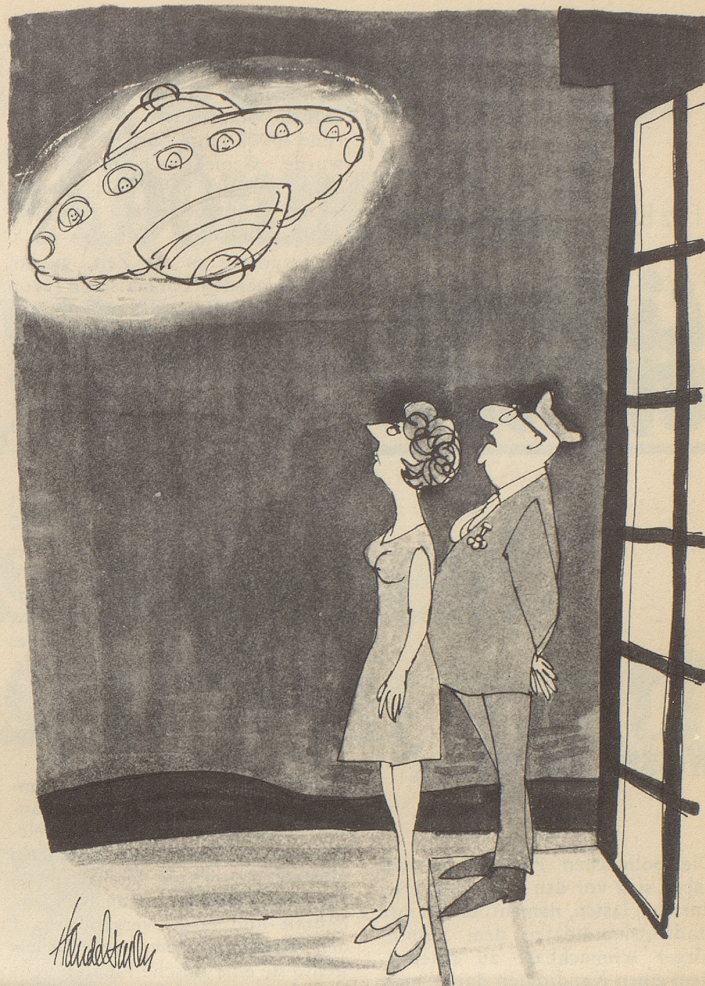
«... ich würde es melden, wenn ich nicht überall als Witzbold bekannt wäre!»

Wie, bitte? – O nein, wir spinnen nicht. Wir ließen lediglich unsere guten Sitten durch schlechte Bei-