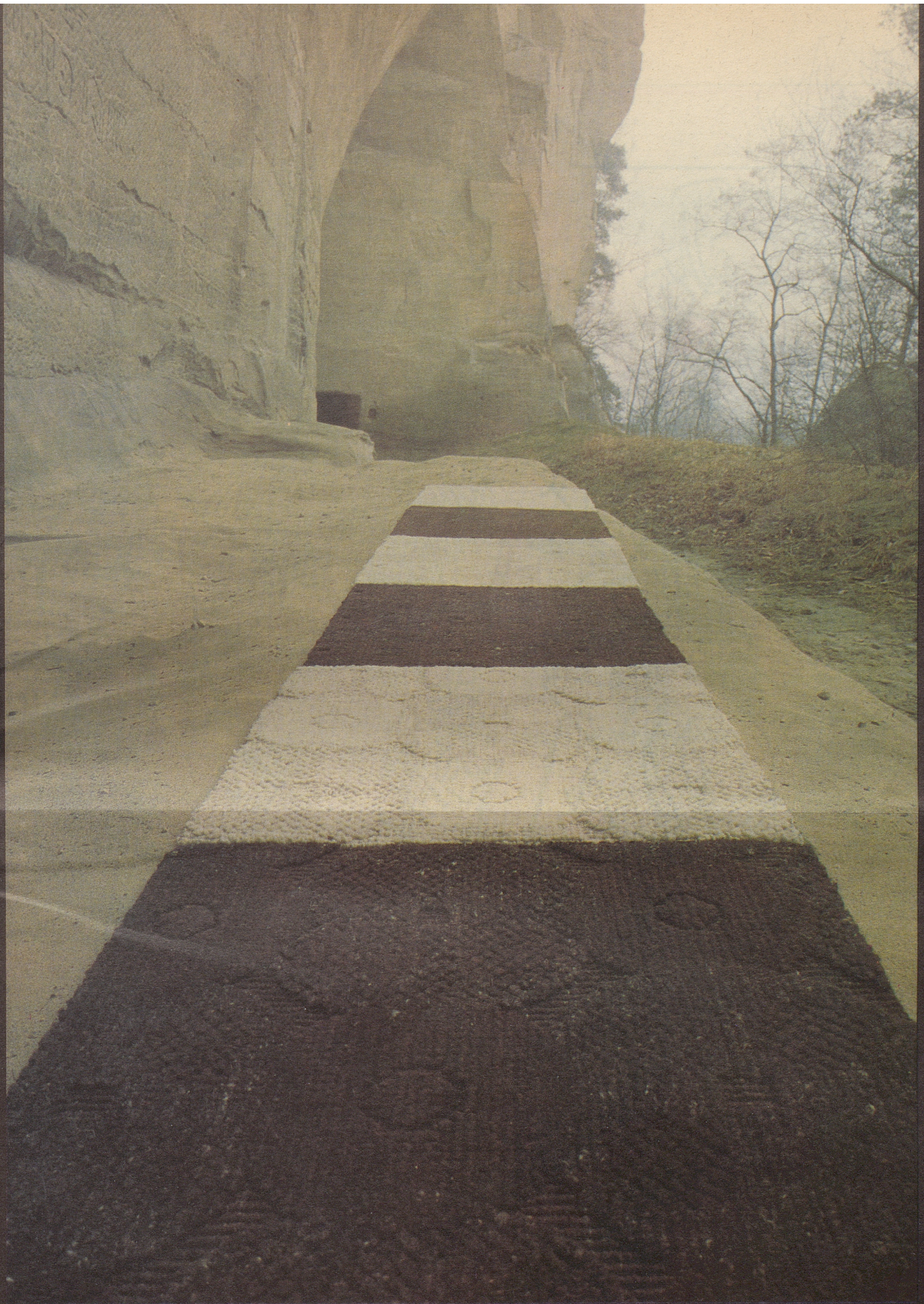
Unter den Gysnau-Flühen bei Burgdorf fotografiert für Möbel-Pfister und das International Wool Secretariat ☞