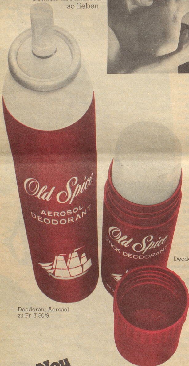
Deodorant-Aerosol zu Fr. 7.80/9.-