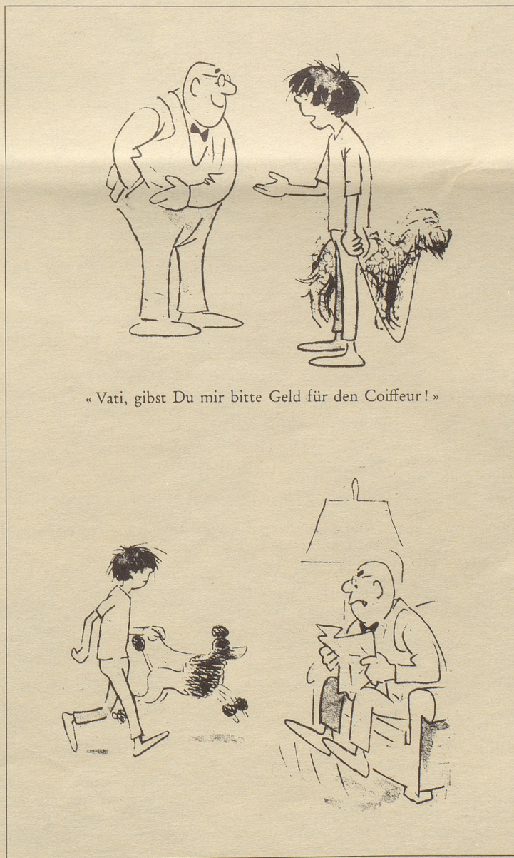
«Vati, gibst Du mir bitte Geld für den Coiffeur!»