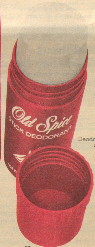
Deodorant-Stick ab Fr. 4.40