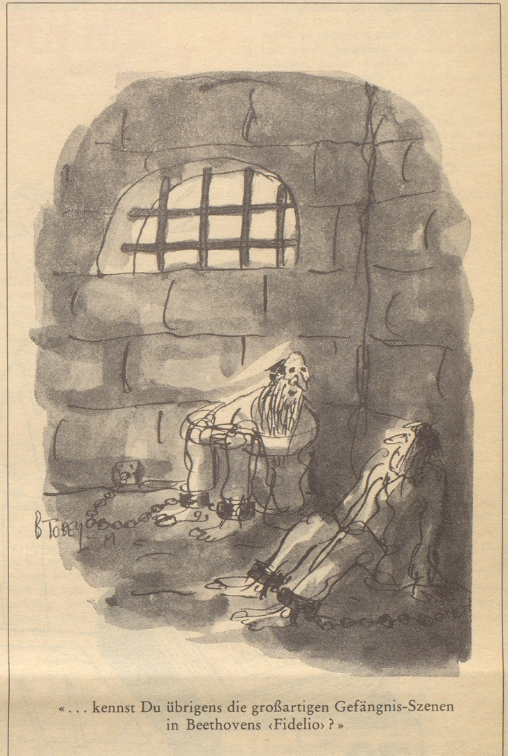
«... kennst Du übrigens die großartigen Gefängnis-Szenen in Beethovens «Fidelio»?»