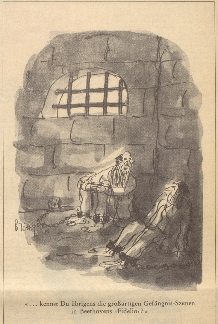
«... kennst Du übrigens die großartigen Gefängnis-Szenen in Beethovens «Fidelio»?»