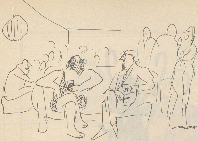
«Ich, mein Herr, lebe in der Zukunft!»