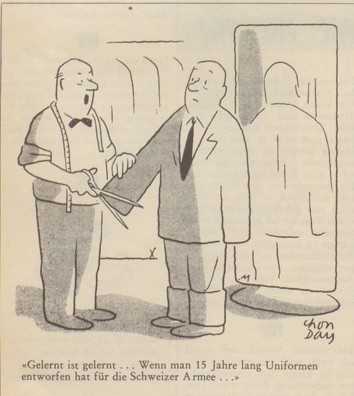
«Gelernt ist gelernt ... Wenn man 15 Jahre lang Uniformen entworfen hat für die Schweizer Armee ...»

werden Sie in 3 Tagen Nichtraucher oder Sie können mit Leichtigkeit das Rauchen auf ein vernünftiges Maß zurückführen. Kurpackung Fr. 19.– in Apotheken und Drogerien. Aufklärung für Sie unverbindlich durch die Medicalia, 6851 Casima (Tessin).