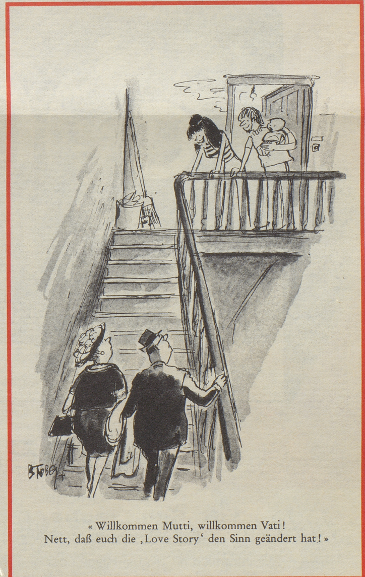
« Willkommen Mutti, willkommen Vati! Nett, daß euch die ‚Love Story‘ den Sinn geändert hat! »