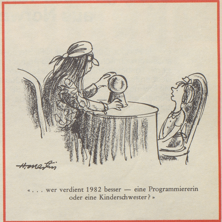
« . . . wer verdient 1982 besser — eine Programmiererin oder eine Kinderschwester? »

So eine richtige grüne Wiese ist schon etwas Schönes. Man begreift die Kühe, wie sie mit Hochgenuß Gras und Blümlein sich einverleiben. Farben machen eben Appetit! Farben machen auch gute Laune, darum haben gutgelaunte Leute auch oft farbenfrohe Orientteppiche. Und daß sie diese bei Vidal an der Bahnhofstraße 31 in Zürich vorteilhaft erworben haben, ist ein Grund für noch bessere Laune!