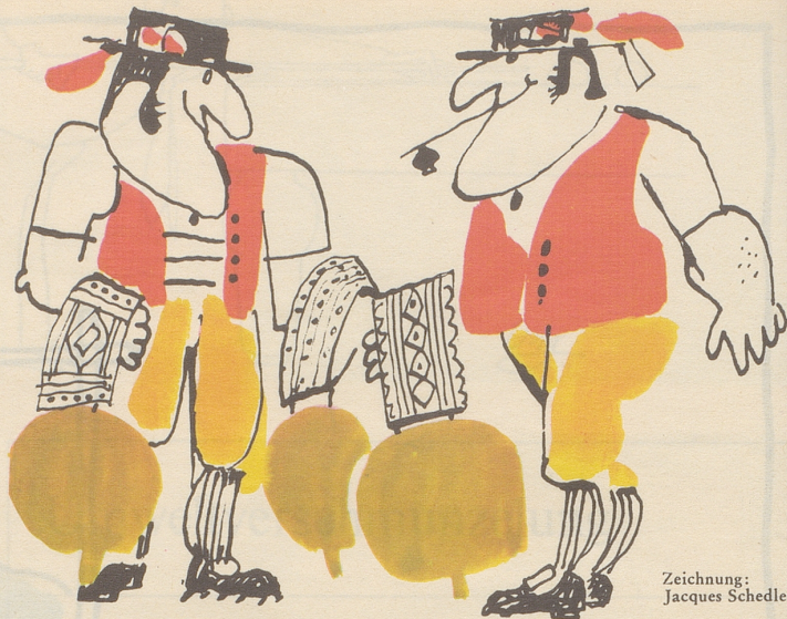
Zeichnung: Jacques Schedler

Schlagfertig oder/und witzig – ich glaube nicht, daß damit das Wesentliche erfaßt wird. Könnte es nicht sein, daß die witzartigen