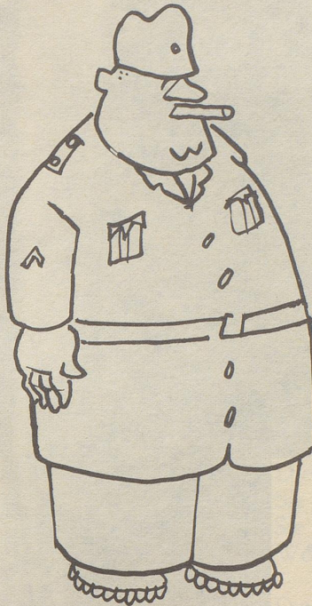
Der Küchenchef – das Fundament der Schweizer Armee schlechthin!