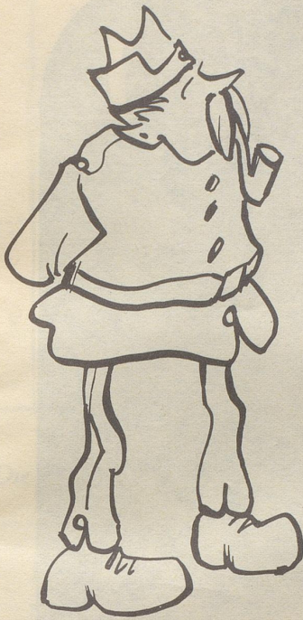
Ein so gekleideter Soldat wäre im Auszug unweigerlich ein Element. Als Landstürmler ist er aber das sicherste Fundament , das es überhaupt gibt. Sonst hätte er sich seiner scheußlichen militärischen Kleidung längst mittels Arzneugnis entzogen ...